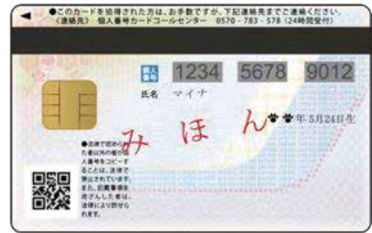
個人番号カード（プラスチック製・写真あり）